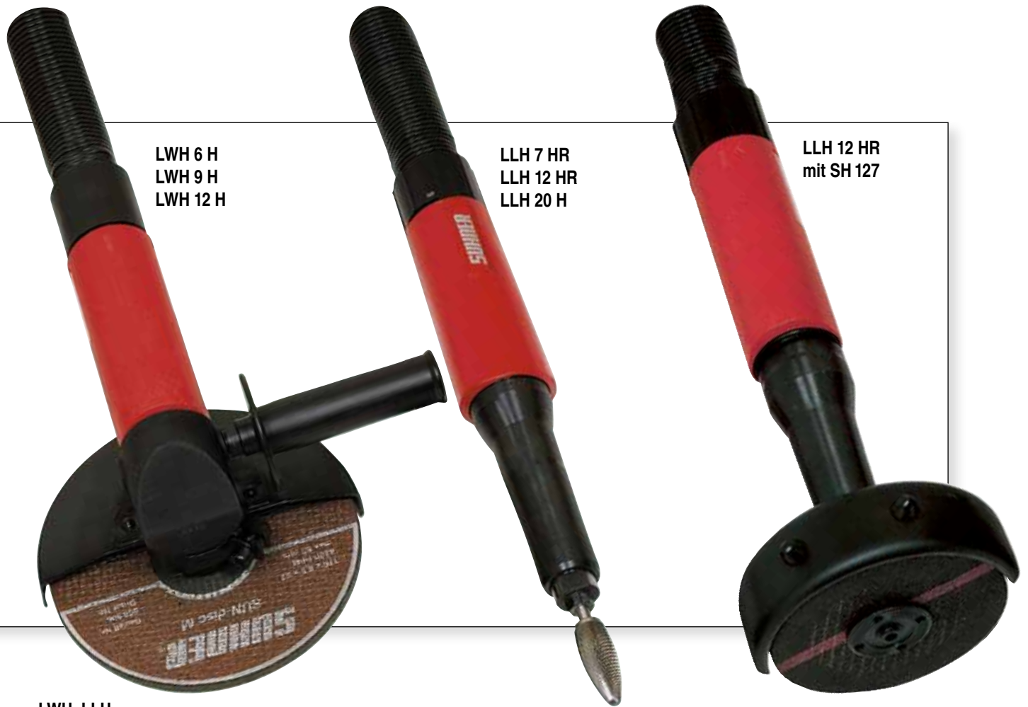
LWH 6 H LWH 9 H LWH 12 H