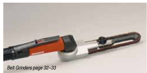
Belt Grinders page 32-33